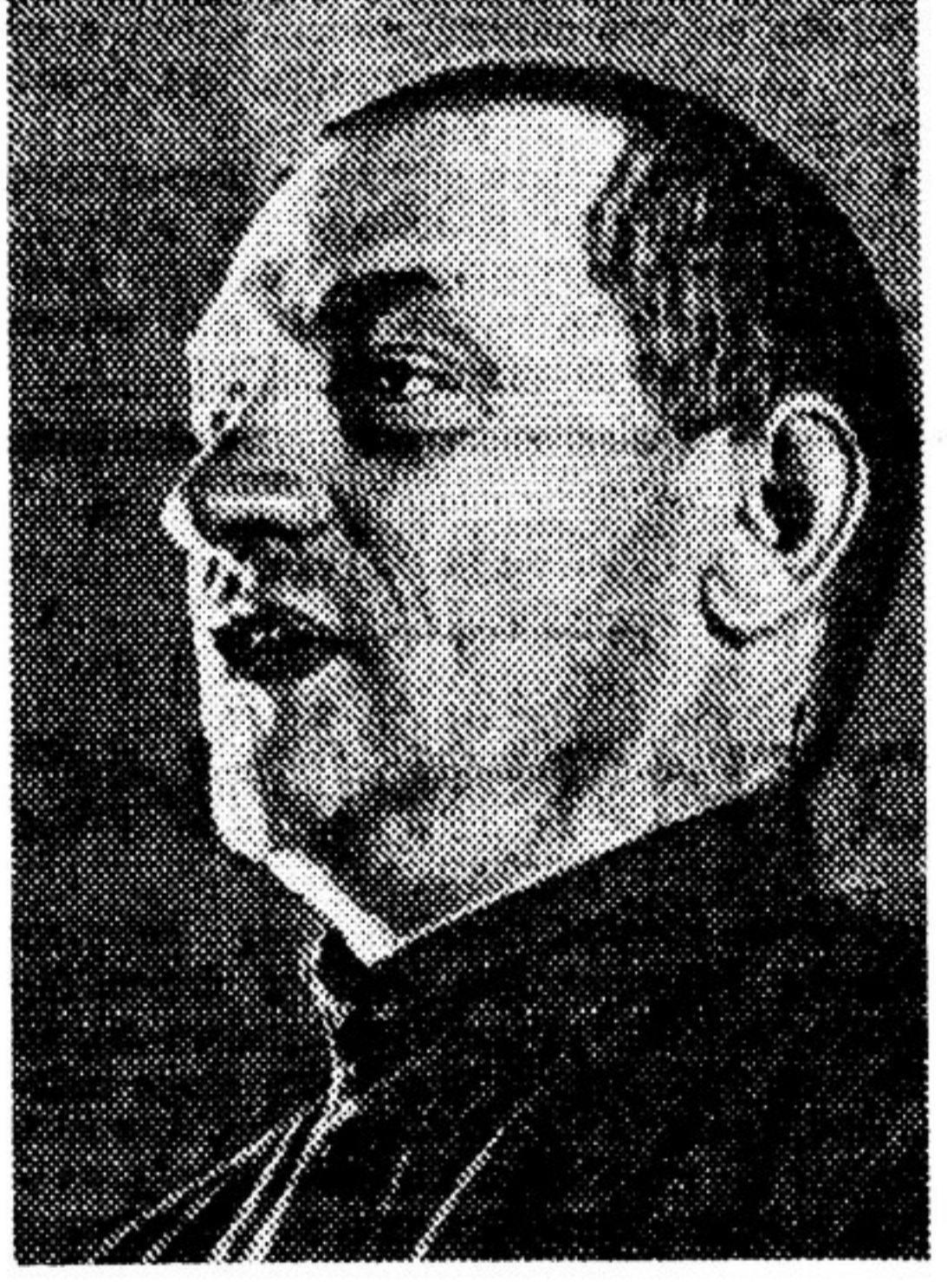
Владимир Петрович Ставский