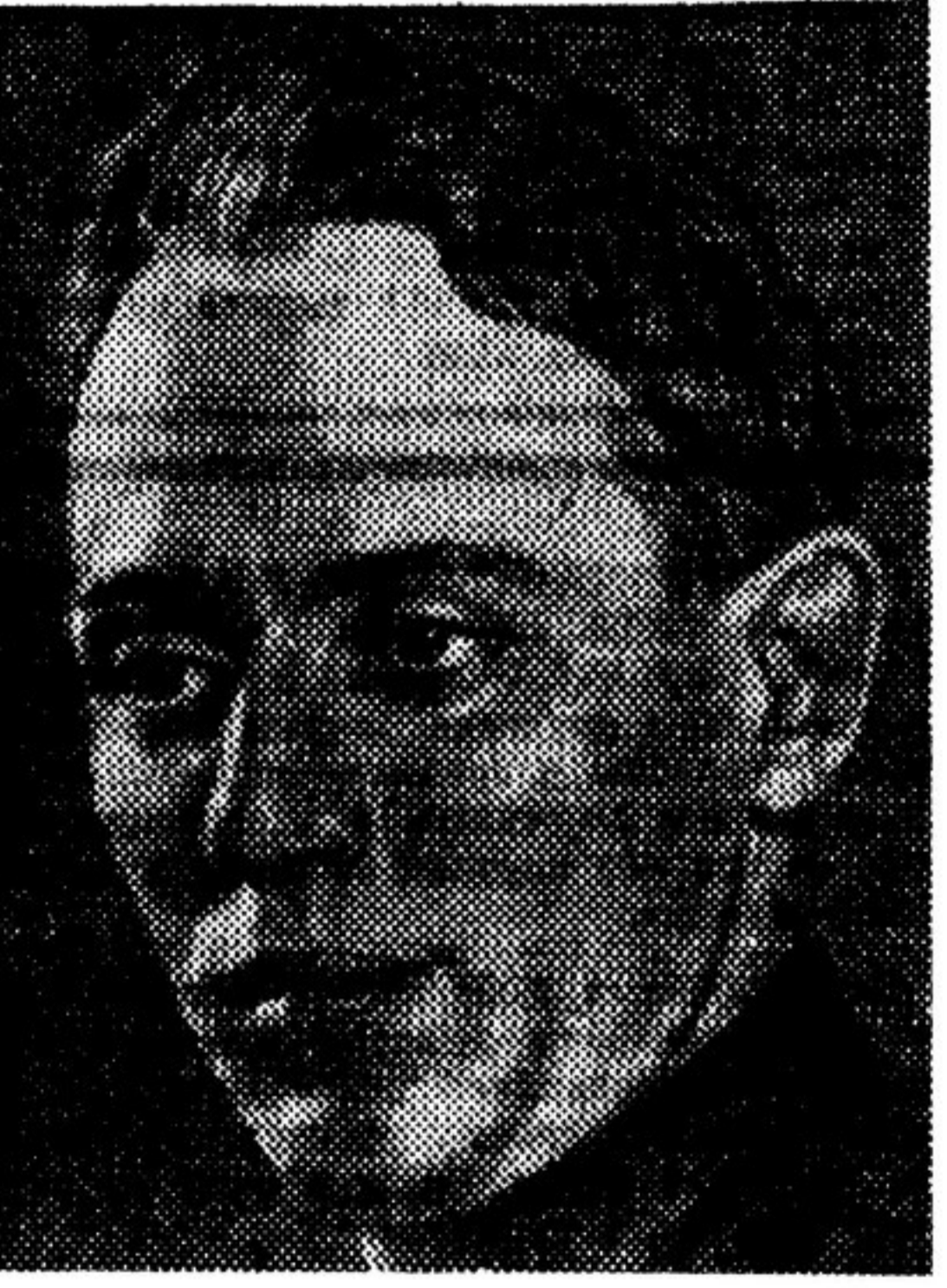
Михаил Александрович Шолохов