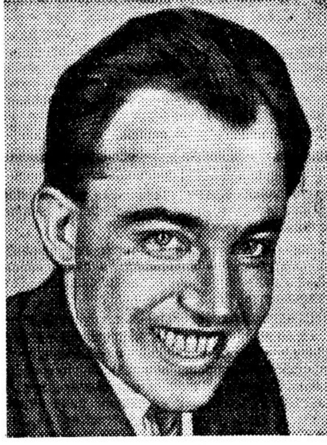
Александр Евдокимович Корнейчук