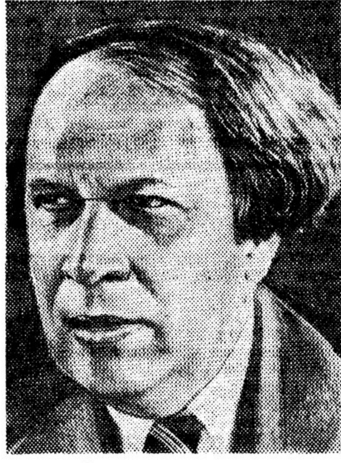
Алексей Николаевич Толстой