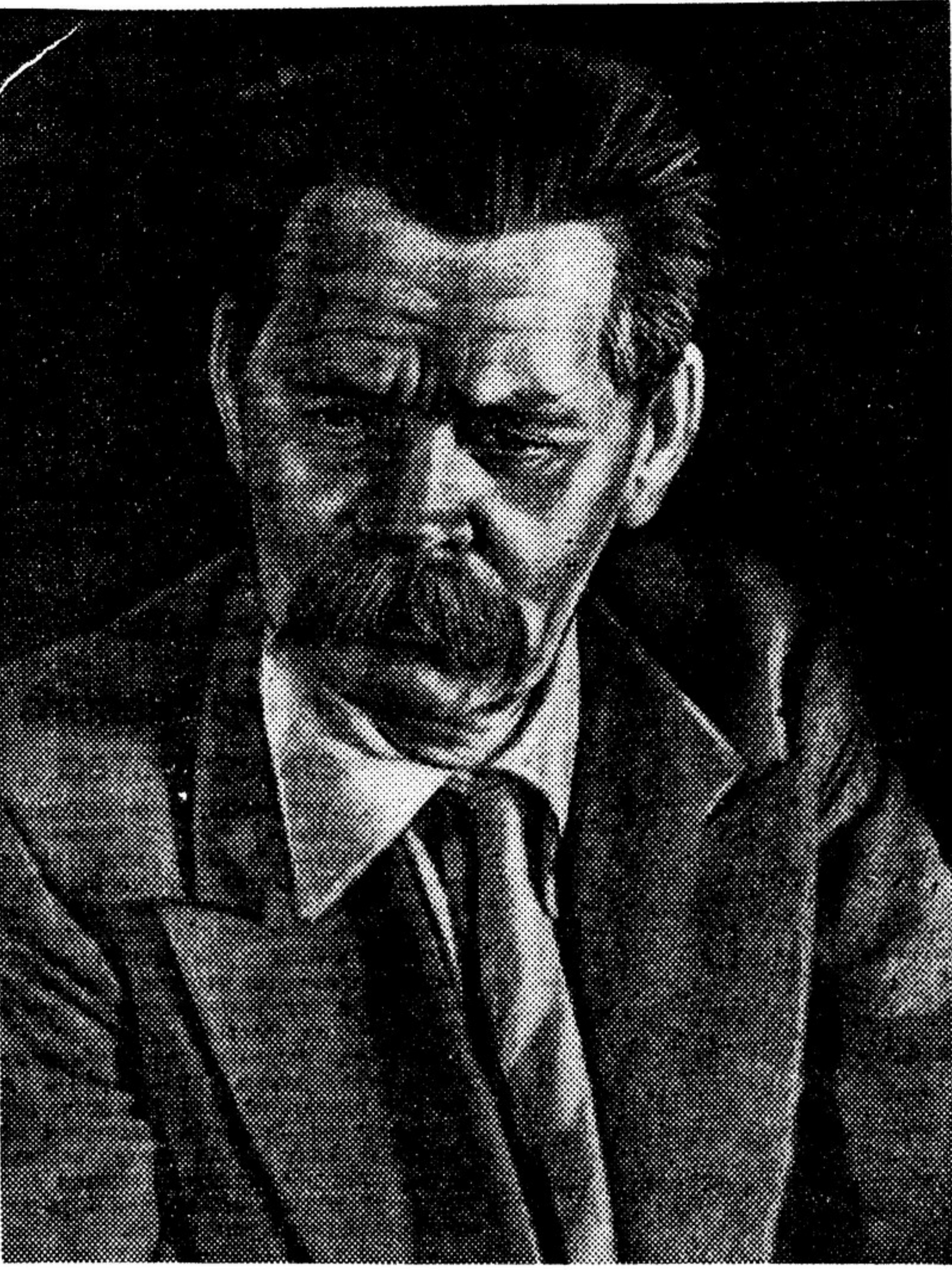
Великий русский писатель Алексей Максимович Горький

Наш народ любит петь, и поэты должны позаботиться, чтобы у него было много разнообразных песен.